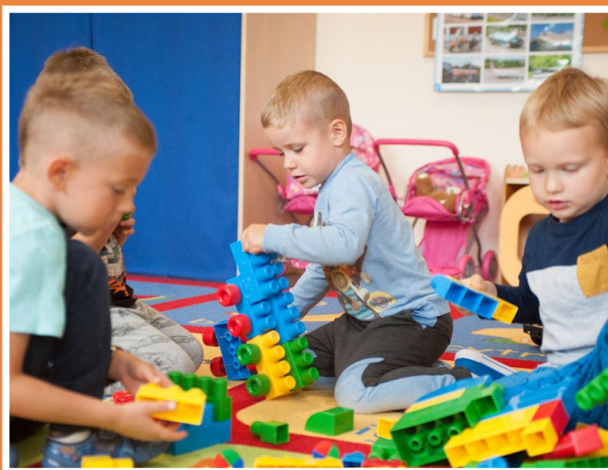
Dzieci z Niepublicznego Żłobka i Przedszkola Nibylandia w Świdnicy z radością spędzają czas w placówce.